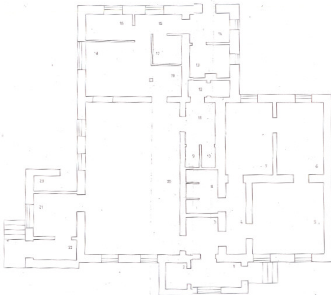
Здание в проекте