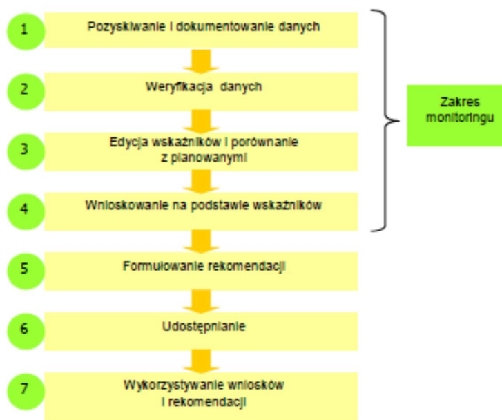
Rysunek 2. Proces oraz zakres monitoringu wdrażania elementów Strategii w Gminie Krzywca